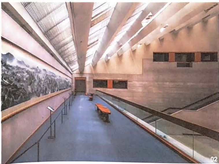
01 兒童美術館的戶外沙場，使小朋友們最喜歡嬉戲的地方。02 高雄市立美術館本身就是一棟現代主義建築。內部以挑高、幾何為主元素。03 高雄 HH 為南台灣首棟普立茲克住宅大樓。04 高雄 HH 外觀具現代感，入口處更有特色鋼雕建築藝術。